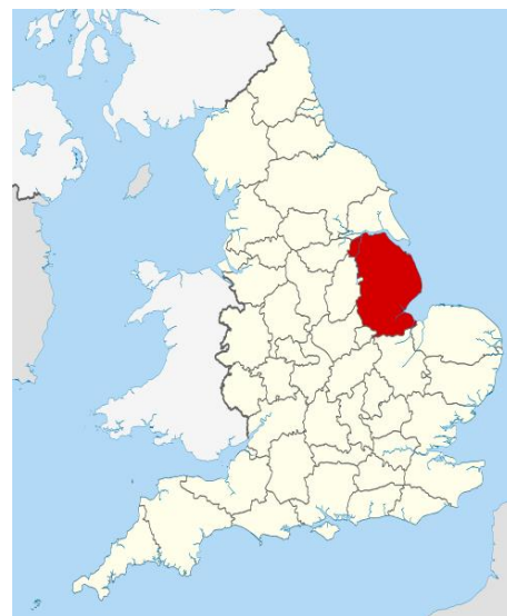
Место Линкольншира в Англии