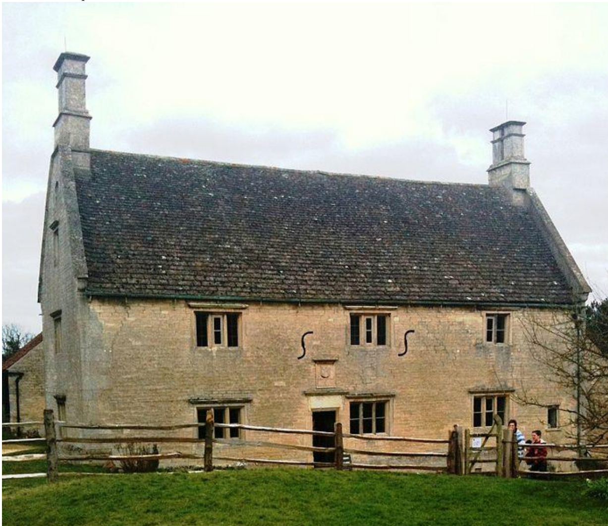
В.Э.: Вулсторпский Манор – дом, в котором родился Исаак Ньютон.

Один из таких родников – в самом центре Вулсторпа, от него в сторону Грэнтэма бежит весёлый ручеёк, который, встретившись в дороге со своими собратьями, и образует Уитэм. Здесь, неподалёку от родника с целебной водой, и стоит вулсторпский Манор – сцена первых лет жизненной драмы Ньютона.