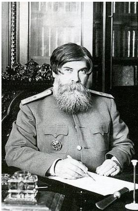
Владимир Михайлович Бехтерев

Понятия о гипнозе и внушении в обыденной жизни постоянно фигурируют рядом друг с другом и трактуются нередко как почти равнозначные. Это объясняется исключительно тем, что